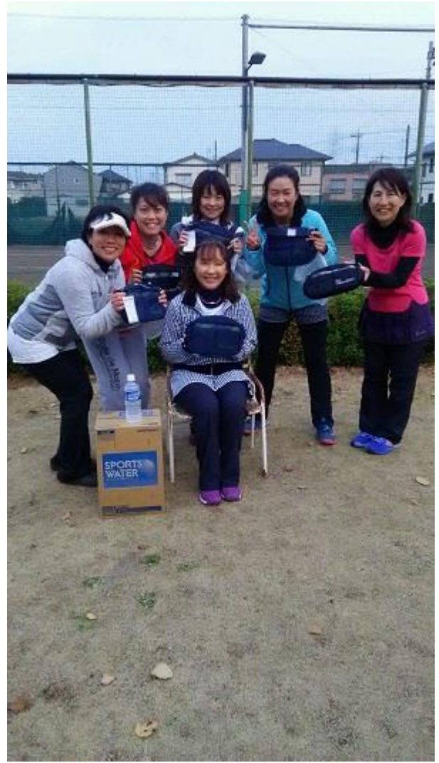
準優勝 おそうざいクラブ